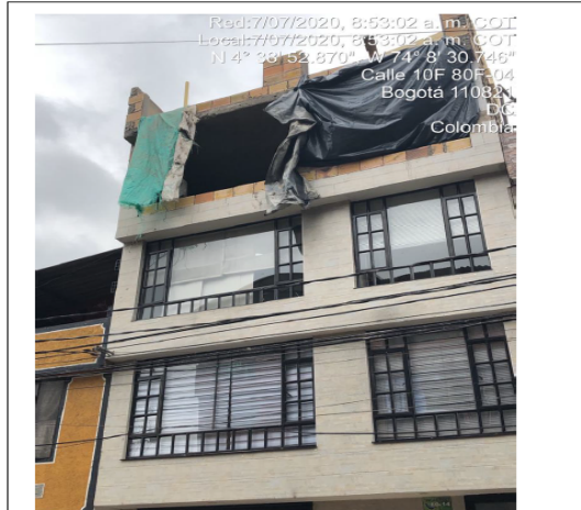
Fotografía No. 2. Remodelación en Predio con CHIP AAA0148KJMS.