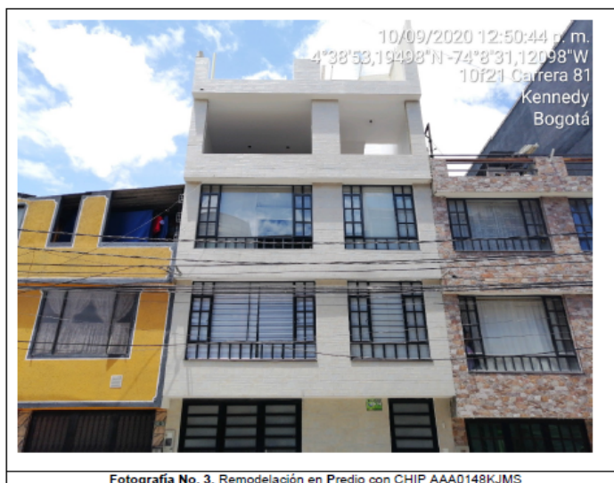
Fotografía No. 3. Remodelación en Predio con CHIP AAA0148KJMS