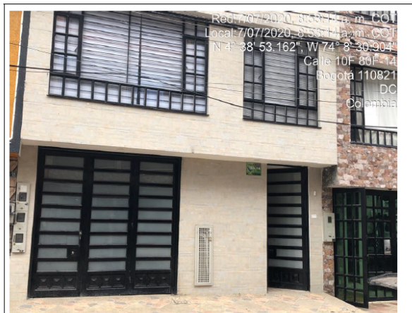
Fotografía No. 1. Remodelación en predio con CHIP AAA0148KJMS.